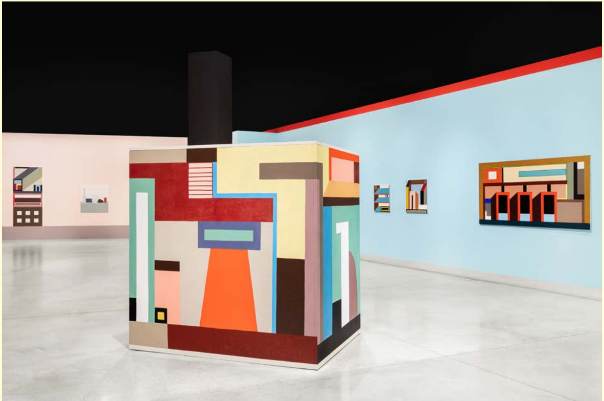
Nathalie du Pasquier, Campo di Marte . Vue d'exposition. Peinture à l'huile sur bois, huile sur toile, huile sur papier encadrée, impression numérique sur papier, papier peint. SOLO/MULTI, Musée d'imagination préventive, Macro 2021. Courtesy de l'artiste. Photo : Agnese Bedini et Melania Dalle Grave de DSL Studio.