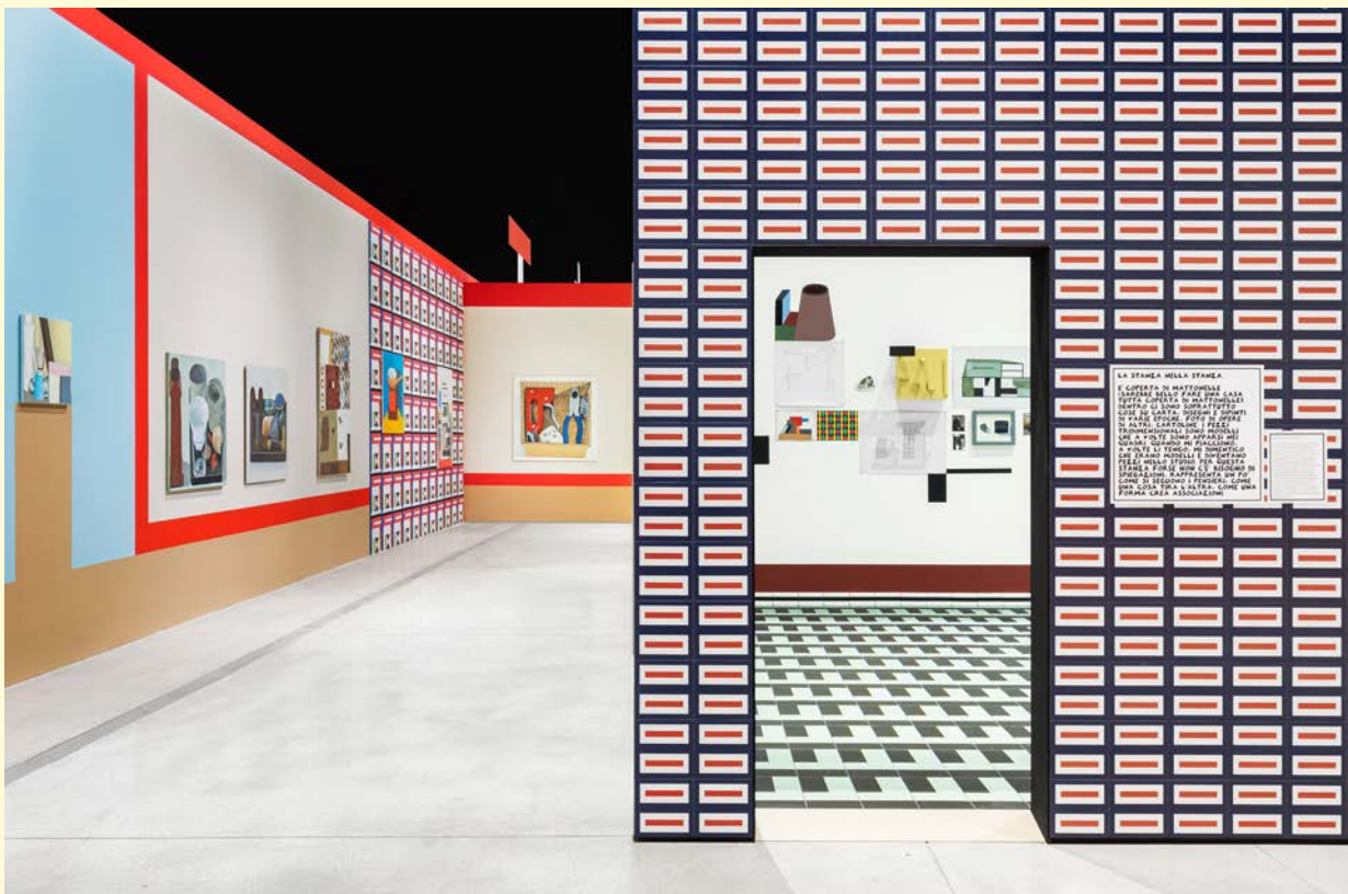
Nathalie du Pasquier, Campo di Marte . Vue d'exposition. Huile sur MDF, huile sur papier encadré, papier encadré, construction en bois peint, huile sur papier, cadre en bois peint, dessin couleur sur papier, dessin noir et blanc sur papier, entrelacs de papiers de couleur, carte postale, photocopie, numérique impression sur papier. SOLO/MULTI, Musée d'imagination préventive, Macro 2021. Courtesy de l'artiste. Photo : Agnese Bedini et Melania Dalle Grave de DSL Studio.