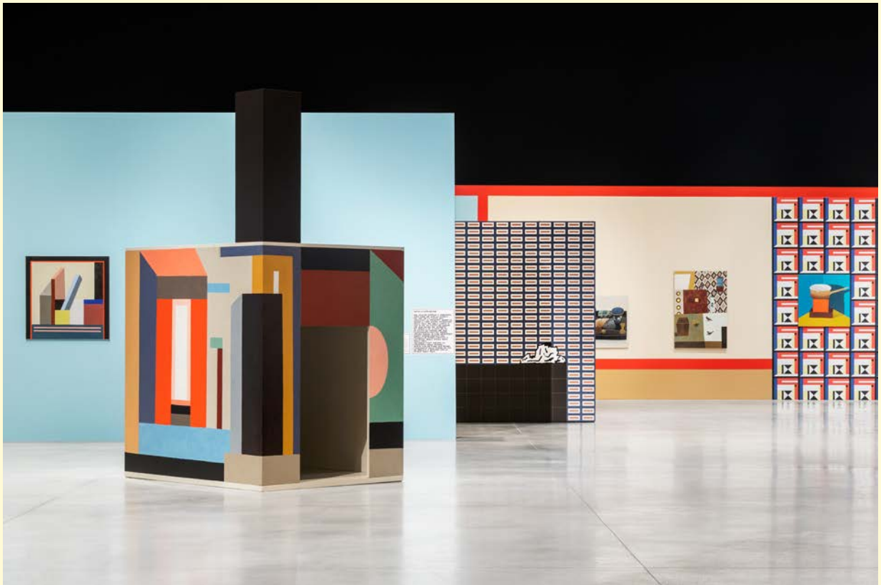
Nathalie du Pasquier, Campo di Marte . Vue d'exposition. Peinture à l'huile sur bois, huile sur toile, huile sur papier encadré, impression numérique sur papier, papier peint. SOLO/MULTI, Musée d'imagination préventive, Macro 2021. Courtesy de l'artiste. Photo : Agnese Bedini et Melania Dalle Grave de DSL Studio.