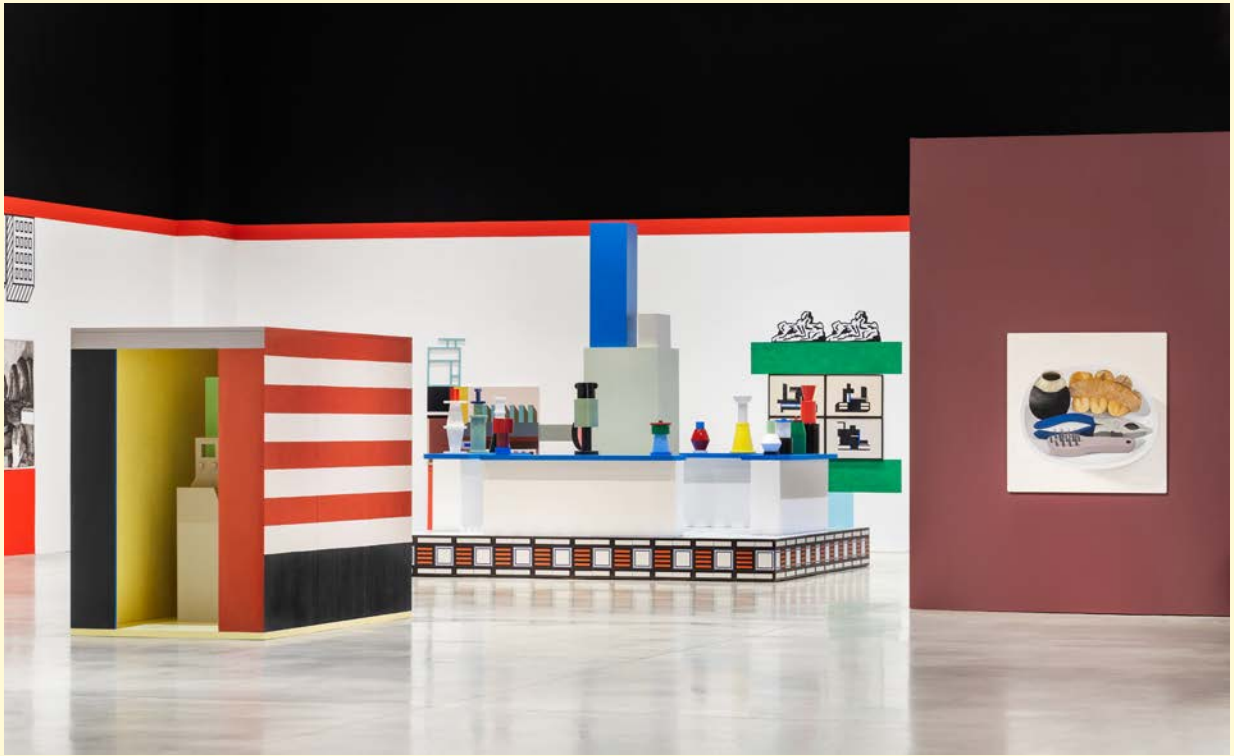
Nathalie du Pasquier, Campo di Marte . Vue d'exposition. Huile sur mdf, dessin couleur sur papier, impression numérique sur papier, céramique, bois peint, encre sur papier. SOLO/MULTI, Musée d'imagination préventive, Macro 2021. Courtesy de l'artiste, PACE gallery. Photo : Agnese Bedini et Melania Dalle Grave de DSL Studio.