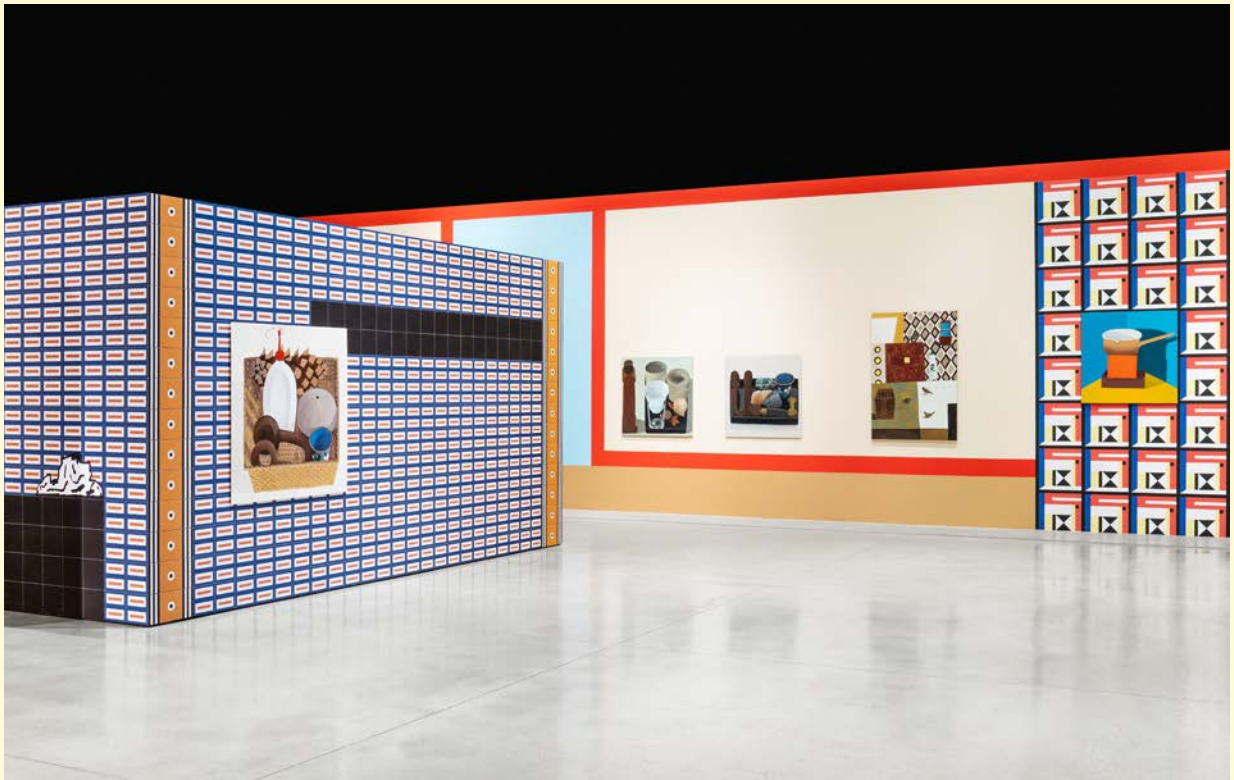
Nathalie du Pasquier, Campo di Marte . Vue d'exposition. Huile sur toile, huile sur papier encadrée, huile sur mdf, impression numérique sur papier, bois peint. SOLO/MULTI, Musée d'imagination préventive, Macro 2021.