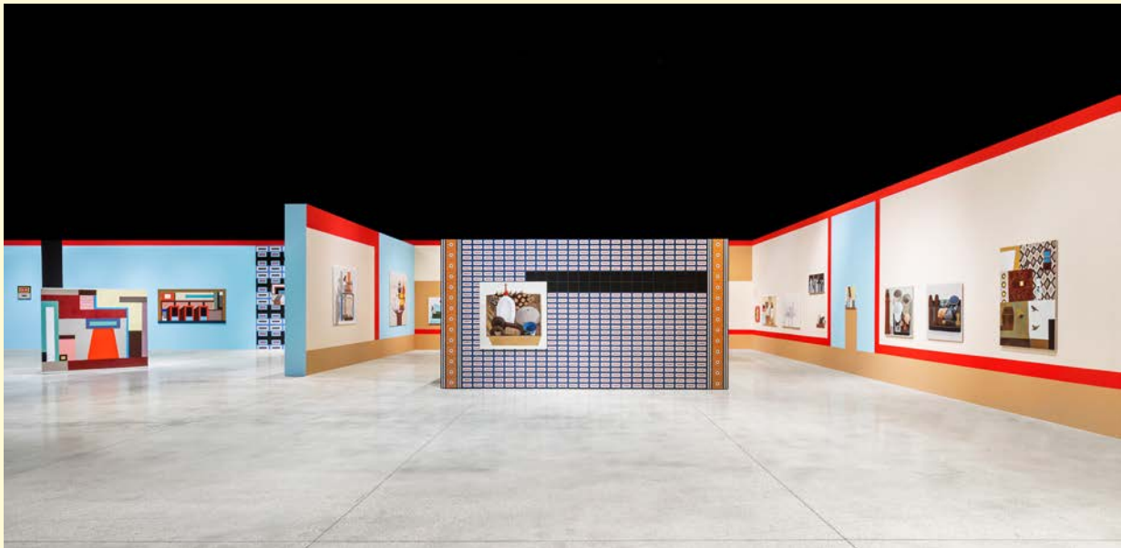
Nathalie du Pasquier, Campo di Marte . Vue d'exposition. Huile sur toile, huile sur papier encadré, huile sur MDF, bois peint. SOLO/MULTI, Musée d'imagination préventive, Macro 2021. Courtesy de l'artiste. Photo : Agnese Bedini et Melania Dalle Grave de DSL Studio