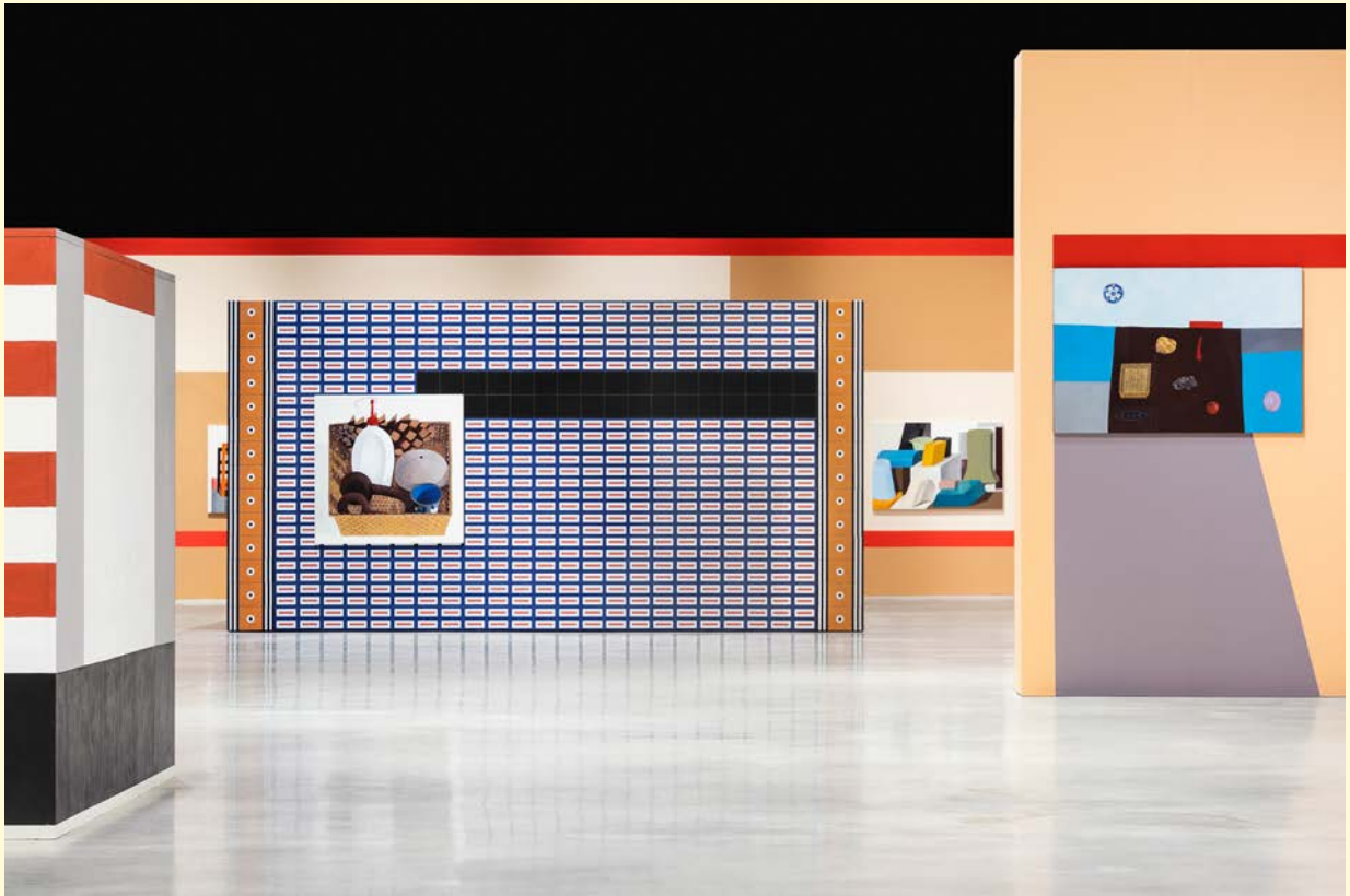
Nathalie du Pasquier, Campo di Marte . Vue d'exposition. Huile sur toile, bois peint SOLO/MULTI, Musée d'imagination préventive, Macro 2021. Courtesy de l'artiste, PACE gallery. Photo : Agnese Bedini et Melania Dalle Grave de DSL.