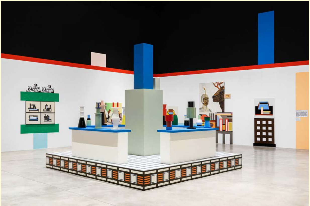
Nathalie du Pasquier, Campo di Marte . Vue d'exposition. Céramique, bois peint, huile sur toile, huile sur papier, dessins de couleur sur papier, impression numérique sur papier. SOLO/MULTI, Musée d'imagination préventive, Macro 2021. Courtesy de l'artiste. Photo : Agnese Bedini et Melania Dalle Grave de DSL Studio.