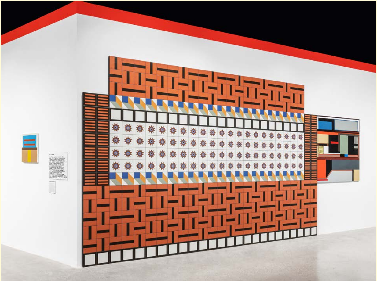
Nathalie du Pasquier, Campo di Marte . Vue d'exposition. Huile sur toile, impression numérique sur papier. SOLO/MULTI, Musée d'imagination préventive, Macro 2021.