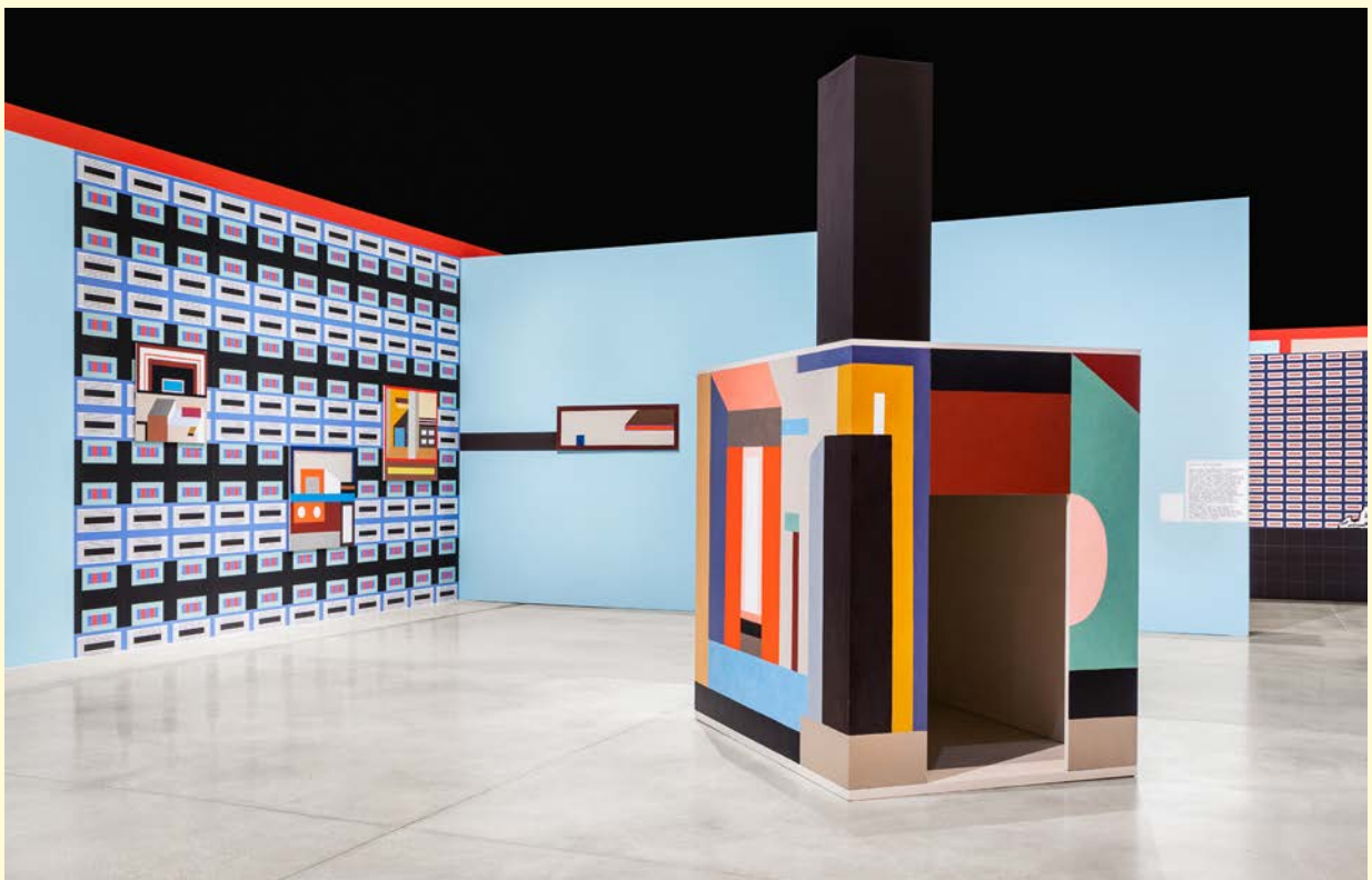
Nathalie du Pasquier, Campo di Marte . Vue d'exposition. Bois peint, huile sur toile, papier peint. SOLO/MULTI, Musée d'imagination préventive, Macro 2021. Courtesy de l'artiste. Photo : Agnese Bedini et Melania Dalle Grave de DSL Studio.