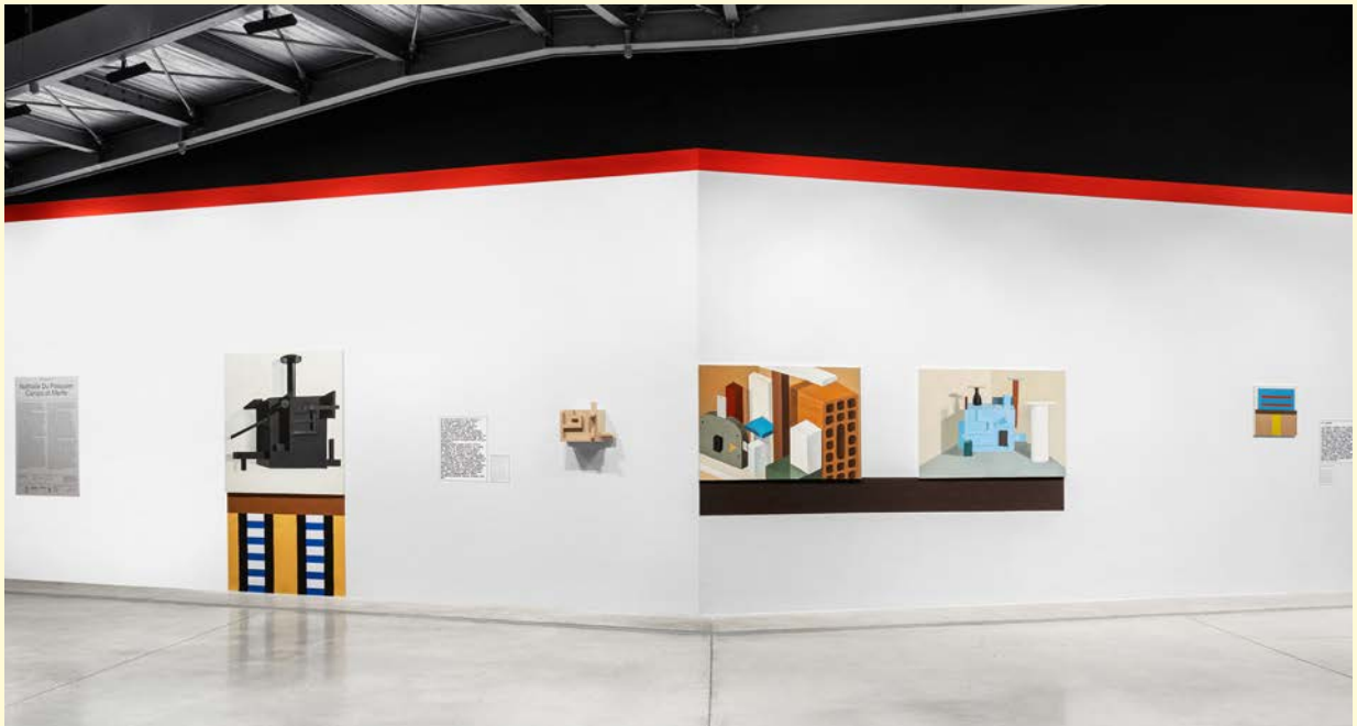
Nathalie du Pasquier, Campo di Marte . Vue d'exposition. Huile sur toile, bois peint. SOLO/MULTI, Musée d'imagination préventive, Macro 2021. Courtesy de l'artiste. Photo : Agnese Bedini et Melania Dalle Grave de DSL Studio.