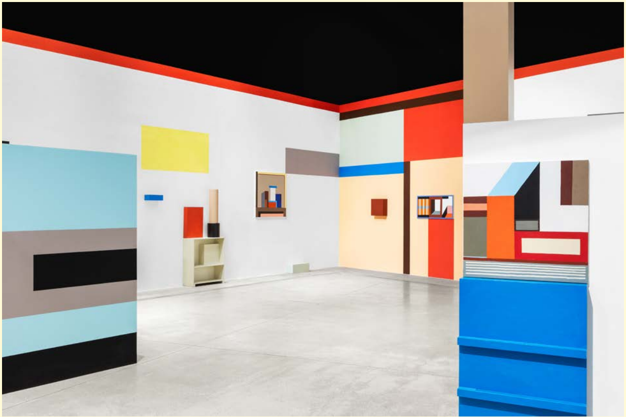
Nathalie du Pasquier, Campo di Marte . Vue d'exposition. Huile sur toile, bois peint. SOLO/MULTI, Musée d'imagination préventive, Macro 2021. Courtesy de l'artiste. Photo : Agnese Bedini et Melania Dalle Grave de DSL Studio.