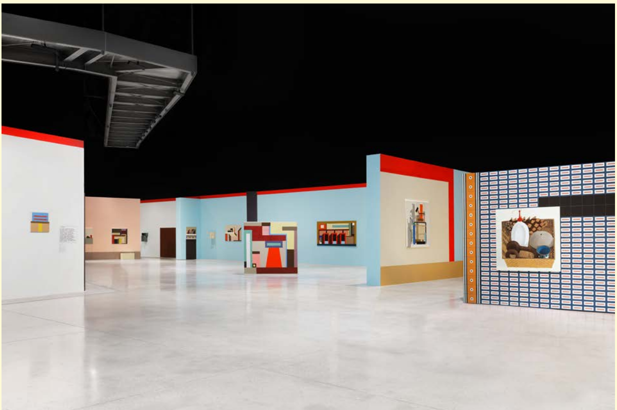
Nathalie du Pasquier, Campo di Marte . Vue d'exposition. Huile sur toile, huile sur bois, bois peint. SOLO/MULTI, Musée d'imagination préventive, Macro 2021. Courtesy de l'artiste. Photo : Delfino Sisto Legnani.