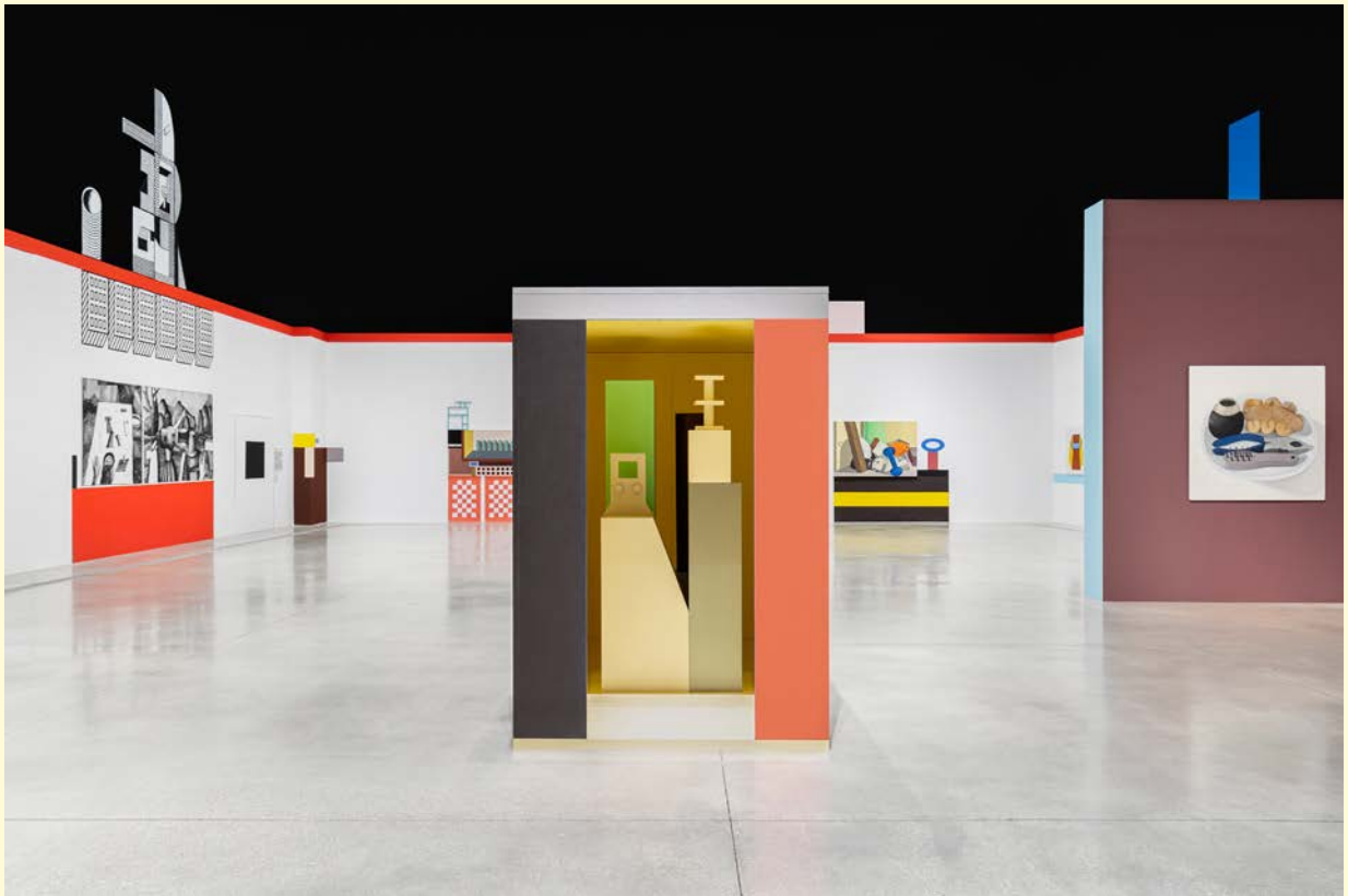
Nathalie du Pasquier, Campo di Marte . Vue d'exposition. Encre sur papier, impression numérique sur papier, bois peint, huile sur toile, huile sur mdf . SOLO/MULTI, Musée d'imagination préventive, Macro 2021.