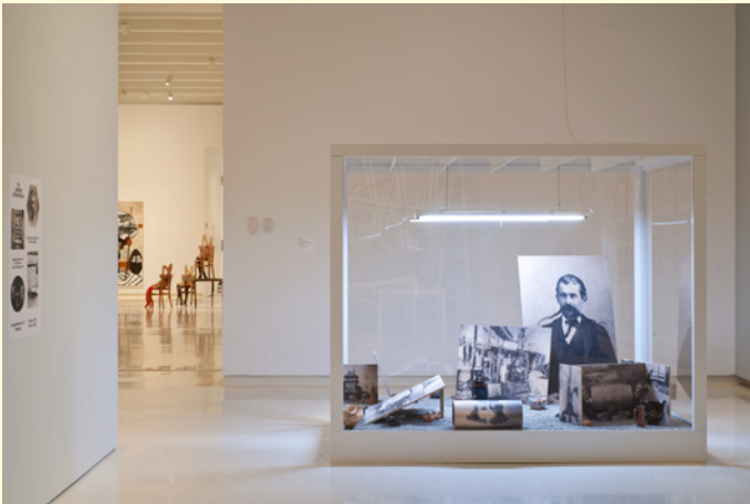
3- Pierre Leguillon, Tifafai , Fondation nationale des Arts graphiques et plastiques, Paris, 2013. Collection Les Abattoirs, Frac Midi-Pyrénées, Toulouse.