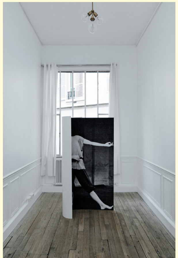
2- Sans titre (Dana) , impression sur papier, aluminium et peinture, 2014. exposition Triangle France.