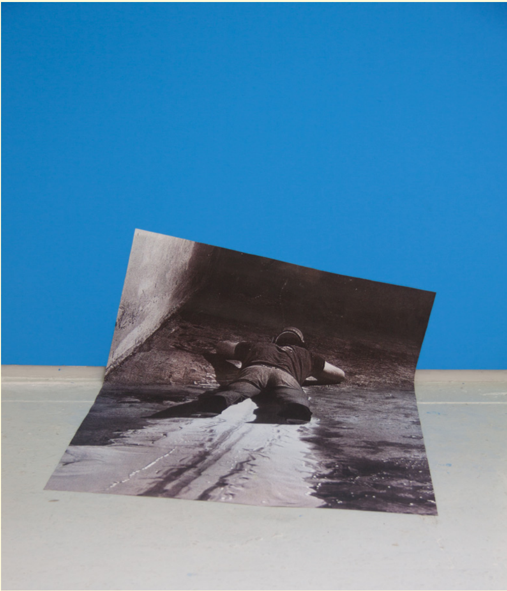
1- Sans titre (Mc Carty) , impression sur papier et encapsulage, 2013.