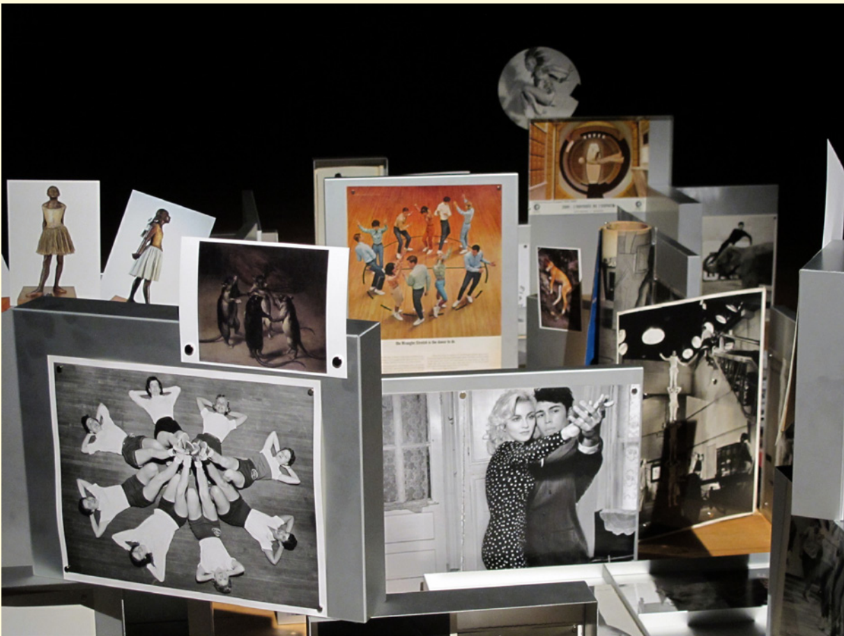
6 et 7- Pierre Leguillon, La grande évasion , Musée de la Danse, Rennes, France, 2012. Collection Musée de la Danse.