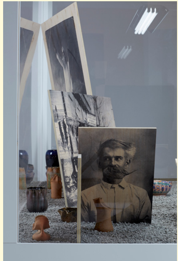
4 et 5- Pierre Leguillon, A Vivarium for George E. Ohr , 2013. Carnegie International, Pittsburgh, USA, 2013.