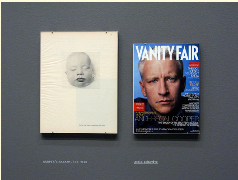
1 et 2- Pierre Leguillon, Diane Abus, A Printed Retrospective, 1960–1971 , Moderna Museet Malmö, Suède, 2010. Collection Kadist Art Foundation, Paris et San Francisco.