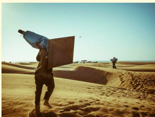
KHALIL NEMMAOUI, Sans titre 2018. Epreuve d'artiste.

En transports en commun, TER ou TGV arrêt Béziers. À la gare, Bus Ligne E, dir. Portes de Valras-Plage, arrêt Promenade à Sérignan.