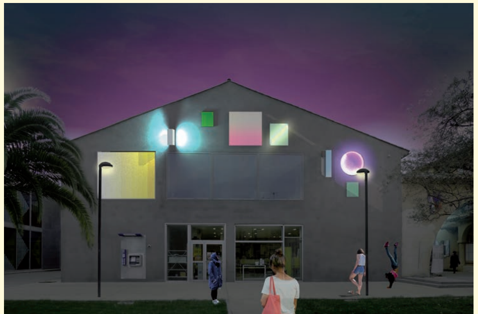
Extension du Musée régional d'art contemporain Languedoc Roussillon Midi Pyrénées Il faut reconstruire l'Hacienda , Bruno Peinado, œuvre pérenne sur la façade de l'extension du Mrac, Sérignan, 2016, réalisateur d'image YALA Yvon Arramounet labiorbe ADE, © Bruno Peinado.

Il faut reconstruire l'Hacienda 21.5 - 09.10.2016