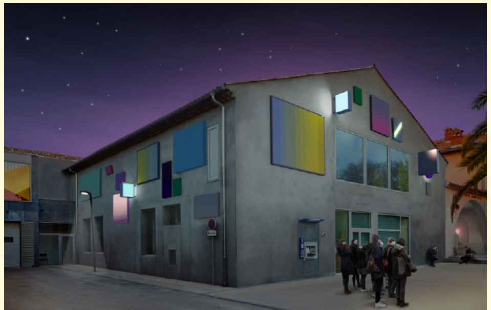
Extension du Musée régional d'art contemporain Languedoc Roussillon Midi Pyrénées Il faut reconstruire l'Hacienda , Bruno Peinado, œuvre pérenne sur la façade de l'extension du Mrac, Sérignan, 2016, réalisateur d'image YALA Yvon Arramounet labiorbe ADE, © Bruno Peinado.

Il faut reconstruire l'Hacienda 21.5 - 09.10.2016