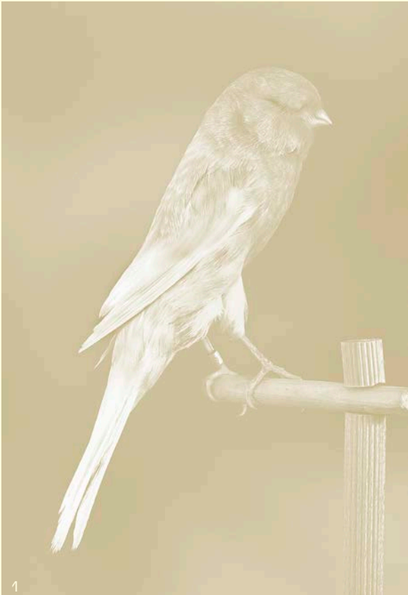
1. Carsten Höller, Canary, 2009, FNAC 2011-0165, Centre national des arts plastiques