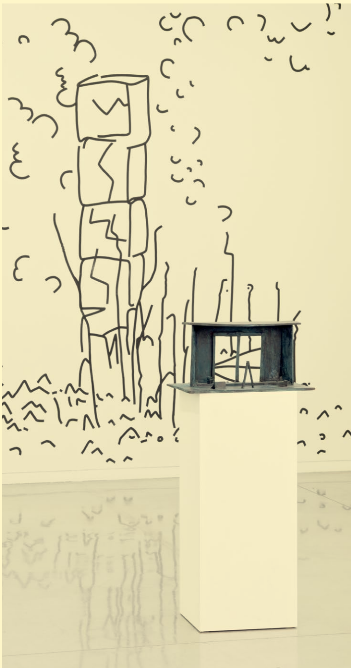
Vue de l'exposition ALLONS.