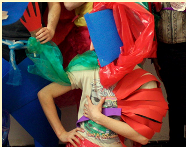
© Renaud Hélène et Maud Cazaux

Mes vacances au musée: Troubleshop, atelier des artistes Renaud Hélène et Maud Cazaux. Cet atelier de création de costumes invite les enfants à expérimenter le vêtement à travers le jeu, le hasard et la création à plusieurs mains. Les deux artistes, Renaud Hélène et Maud Cazaux, proposent d'explorer le vêtement comme un terrain d'expérimentation, en partant du corps, du mouvement et de l'imaginaire collectif. Le vêtement devient alors un outil pour se transformer, se raconter autrement et imaginer de nouvelles façons d'être au monde. Horaires: 10h-12h pour les 5-7 ans et 15h-17h pour les 8-12 ans. Sur réservation. 8 €/2 jours/enfant.