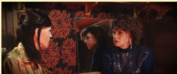
Brice Dellsperger: Body Double 40, 2024. Collection Frac Occitanie Montpellier.

Gratuit. → Frac Occitanie Montpellier. 4 rue Rambaud, Montpellier.