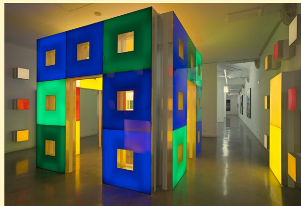
Daniel Buren: La Cabane éclatée aux caissons lumineux colorés, 1999-2000.