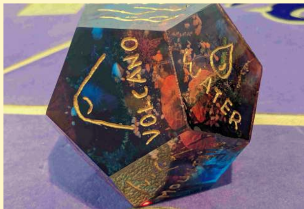
Marie Havel: On a roll of the dice (détail), 2024. Courtesy de l'artiste. Photo: Marie Havel. © ADAGP, Paris, 2024.

Horaires: 10h-12h pour les 5-7 ans et 15h-17h pour les 8-12 ans. Sur réservation. 8 €/2 jours/enfant.