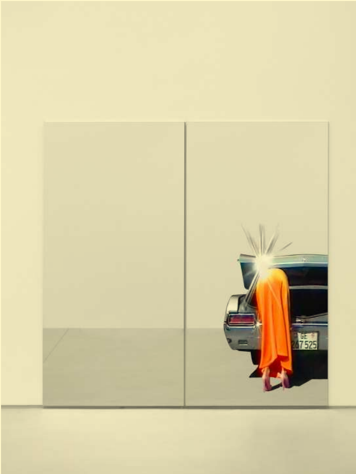
Sylvie Fleury: Vanity Case (Pistoletto), 2024. © Sylvie Fleury. Photo: Pierre Tanguy. Courtesy Galerie Thaddaeus Ropac London, Paris, Salzburg, Seoul.

À travers une esthétique pop et des matériaux – voire des objets – empruntés au monde du luxe, de la mode, des cosmétiques ou encore de l'automobile, Sylvie Fleury expose les paradoxes de notre culture obsédée par les apparences et l'image. Elle utilise le langage de la publicité et du marketing non pas pour vendre un produit mais pour analyser la machine qui fabrique le désir de consommation. L'artiste présente des installations emblématiques telles que les Shopping bags – œuvre ready-made issue d'une journée d'achats – des sculptures et peintures détournant avec humour les œuvres minimales des artistes modernes américains, des pièces en néon aux slogans publicitaires, des vidéos mettant en scène des femmes et des voitures de collection, des peintures inspirées par des palettes de maquillage de marques célèbres et une peinture murale in situ , clin d'œil à l'artiste Daniel Buren.