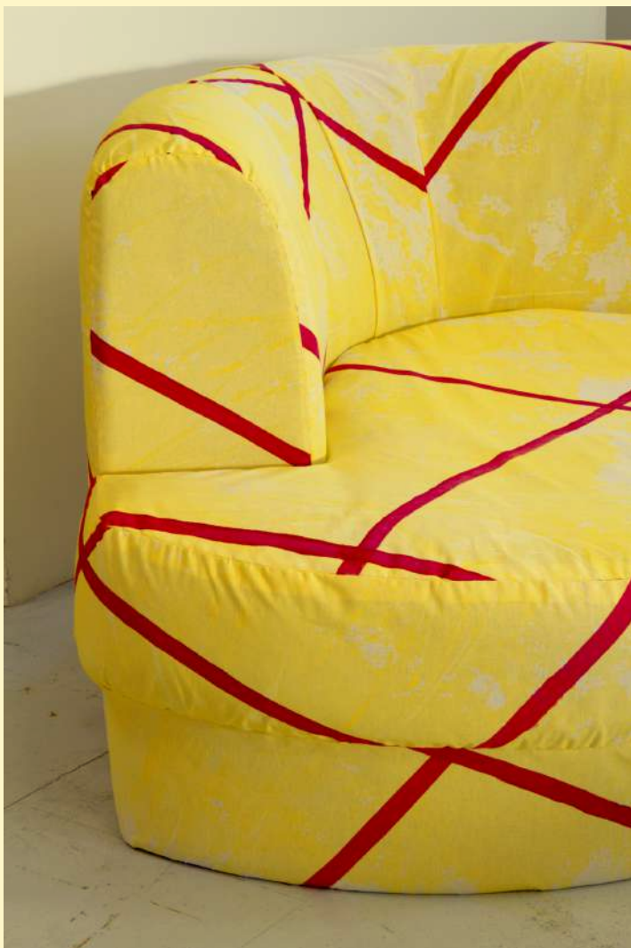
Anna Meschiari: Dormeurxeuse (détail), 2025.