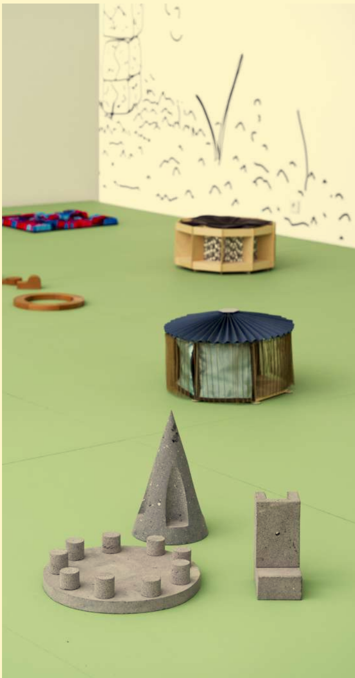
Vue de l'exposition ALLONS.