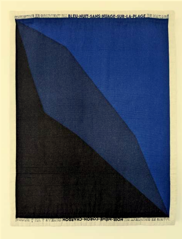
Armelle Caron: Le surgissement du bleu, 2024. Production centre d'art Le Lait et Région Occitanie. Courtesies de l'artiste.

En parallèle de son exposition, Armelle Caron a créé pour le Mrac, une application web inédite intitulée CHROMOGRAM#1 ou Tangram des couleurs . À travers une quête dans l'exposition de collection ALLONS , l'artiste invite le public à observer attentivement les œuvres et leurs nuances de couleurs afin de débloquent une à une les pièces de son tangram.