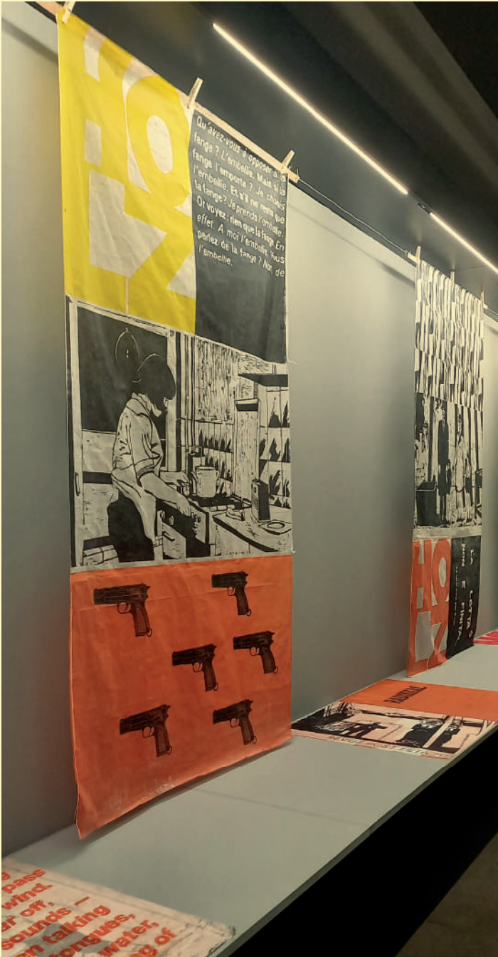
Vue de l'exposition «WREK».