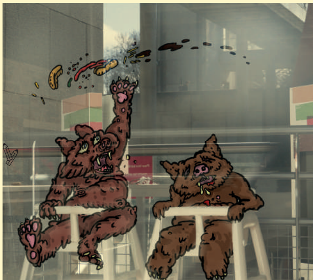
© Arnaud Dezoteux: Panique au Burger King de la Villette, 2021. © ADA&P, Paris, 2024.