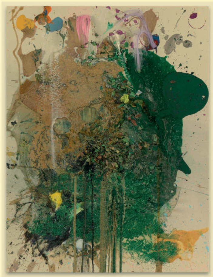
Armleder John: Tutti Quanti, 2018. Collection du Mrac. © John Armleder.