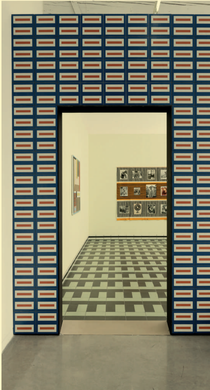
Vue de l'exposition Cosa.