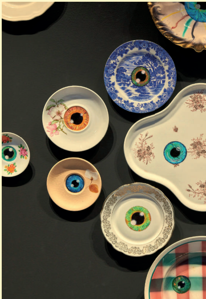
Vidya Gastaldon; Les yeux libres (Limule), 2022. Assiettes peintes et vernies, dimensions variables, 200 x 170 cm environ.

Merci de ne pas jeter sur la voie publique