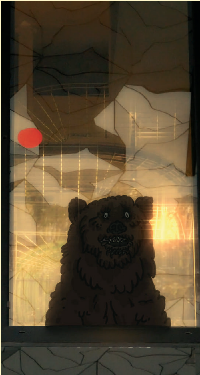
Arnaud Dezoteux: Niche, 2021.

Arnaud Dezoteux propose une immersion au cœur de ses dernières créations dans lesquelles se rencontrent et dialoguent reportages pirates et animation, de curieuses sculptures/architectures multimédia, et des installations vidéos théâtralisées. Le titre de l'exposition s'inspire des slogans publicitaires à double-discours, omniprésents dans le paysage médiatique actuel, visant à nous faire croire que nous sommes libres d'agir alors qu'en réalité, nous n'en avons pas vraiment le choix. L'artiste pose un regard grinçant sur des lieux culturels parisiens et interroge leur place dans la fabrication d'un tourisme de masse. Les plans filmés sont retravaillés par l'artiste qui incruste des dessins d'animaux « parasites » pour créer une distorsion du réel propice à la réflexion.