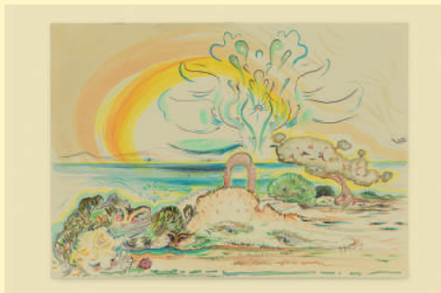
© Vidya Gastaldon: Oasis, 2024. Aquarelle, gouache, acrylique, crayon et crayons de couleur sur papier. Collection privée. Courtesy: Art concept Paris.