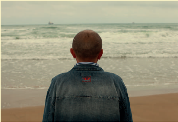
Sophie Calle: Voir la mer (détail), 2011 © Sophie Calle / ADAGP, Paris 2024.

Visites et activités soumises à réservation: 04.67.17.88.95 ou musedartcontemporain@laregion.fr