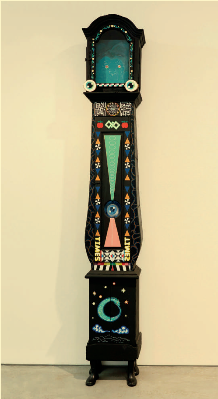
Vidya Gastaldon: Santa Saturnia, 2019. Collection du Cnap, en dépôt au Mrac depuis 2023.

L'exposition de Vidya Gastaldon nous plonge dans différents univers qui mêlent abstraction et figuration, art populaire et art savant. Un espace évoque une maison dans laquelle se réunissent meubles, objets et tableaux trouvés – « Les Rescapés » – à qui elle redonne vie en les peignant. Un alphabet coloré nous invite à un mouvement respiratoire, vocal et méditatif. La projection d'un dessin animé géométrique hypnotique offre une expérience visuelle intense invitant à la méditation. Des paysages, dessinés et peints, rythment le parcours et trouvent leur apogée dans la dernière salle où des figures semblent ne faire qu'un avec la végétation. L'artiste peuple et anime de regards et d'êtres tout ce qui nous entoure pour interroger notre relation au monde et encourager le respect du vivant.