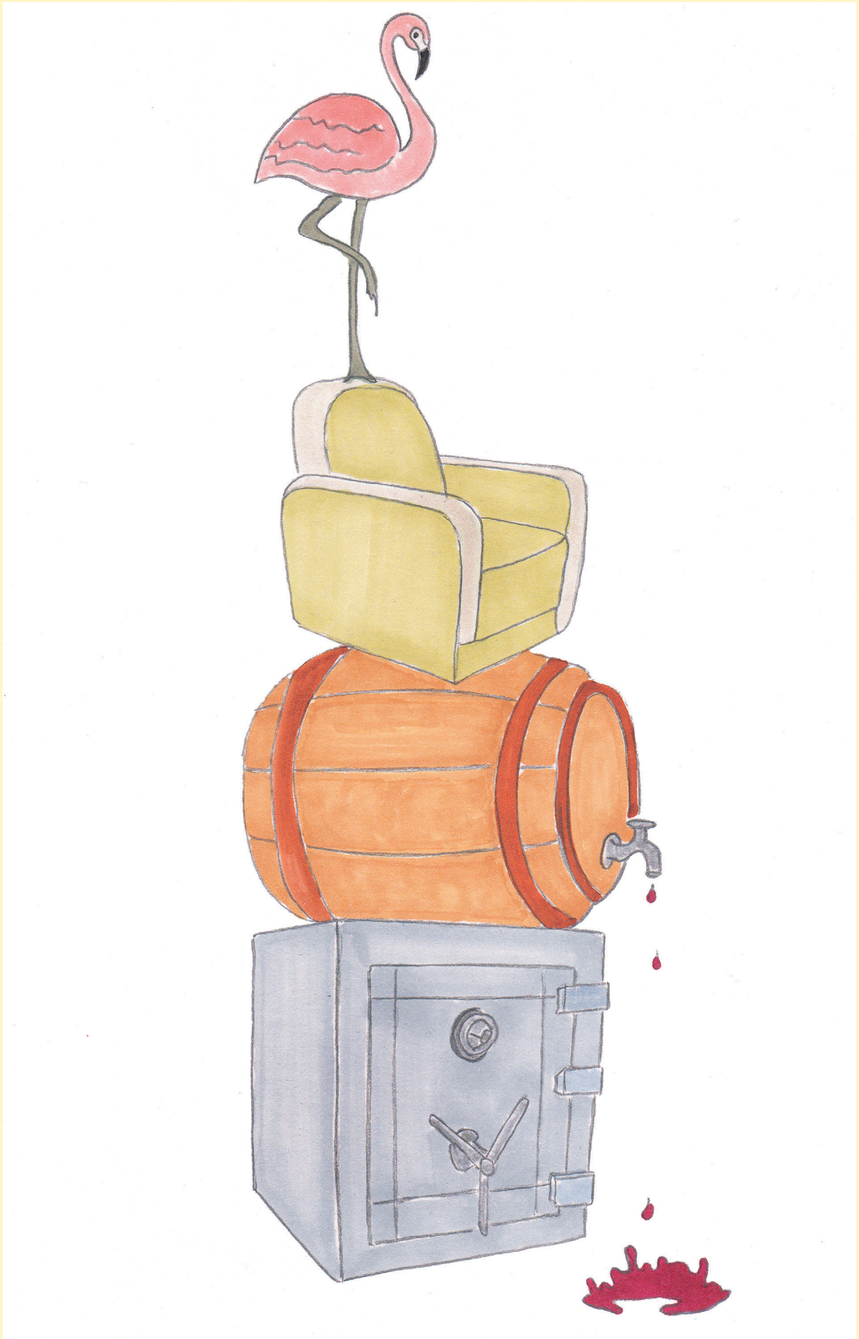
Stack, 2023. Encre sur papier, 30 × 20 cm © et courtesy de l'artiste.