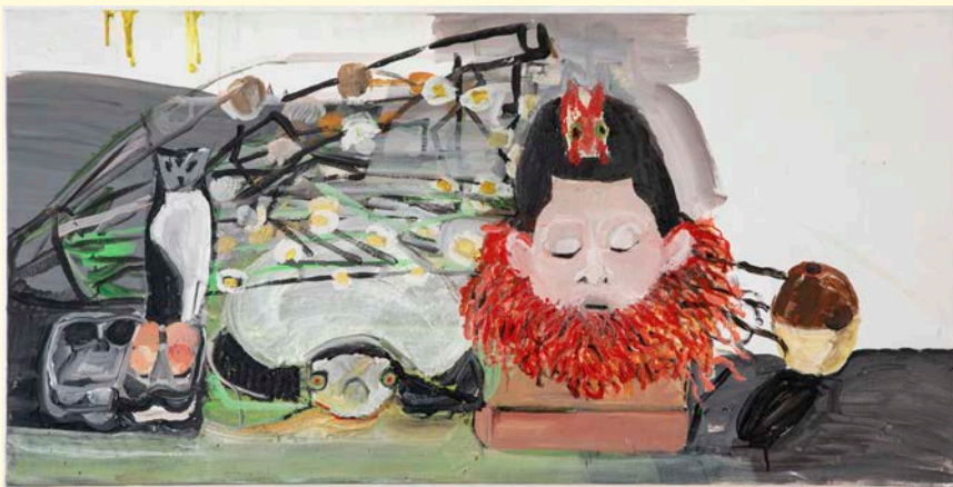
^ Anne-Marie Schneider, Déambulation (détail), 2021. Courtesy de l'artiste et Michel Rein, Paris Brussels © Florian Kleinfenn.