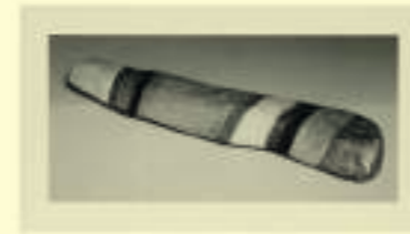
Kurt Schwitters: Painted Stone, 1945-47