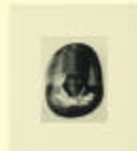
André Breton: Tête collée sur galet avec chapeau cylindrique, n.d.