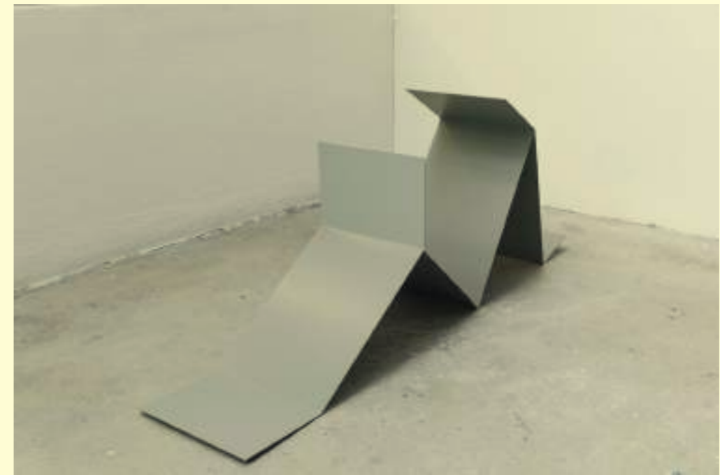
Judith Hopf: Untitled (Laptop Man 10) , 2018.

En quelques plis, les silhouettes anguleuses des sculptures de Judith Hopf évoquent des humanoïdes vissés à leur ordinateur portable, déjà fusionnés peut-être. Leur attitude renvoie au répertoire de poses avachies propres au télétravail, aux start-up et aux activités « créatives » : les « Laptop Men » travaillent allongés ou appuyés à un coin de mur, en bons travailleurs free-lance. Sous le couvert d'une sculpture minimale, d'une grande rigueur formelle, Judith Hopf invente une nouvelle iconographie critique du travail. Ses personnages hybrides font référence à Contrat entre les hommes et l'ordinateur , un texte-manifeste publié en 2010. L'artiste y proclame qu'« aucun instrument ni aucune machine traitant des données électroniques ne doit dans le futur empêcher l'Humanité d'accomplir ou d'être en mesure d'accomplir, en toute liberté, consciemment et sans être assistée, les choses qu'elle fait et les relations qu'elle crée ». Les « Laptop Men » illustrent, avec autant d'ironie que d'empathie, la confusion, toujours croissante, entre vie personnelle et professionnelle, ainsi que notre dépendance morbide aux machines et aux applications.