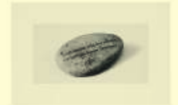
Stéphane Mallarmé: Vers sur un galet d'Honfleur, 1892 ou 1894