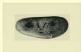
Pablo Picasso: Visage, n.d.