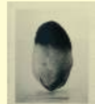
David Hammons: Untitled (Rock Head), 2005