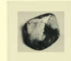
Kurt Schwitters: Stone, 1945-47