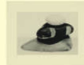
Kurt Schwitters: Untitled (pebble stone sculpture), 1944-47