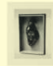
Georges Hugnet: Chactas, n.d.