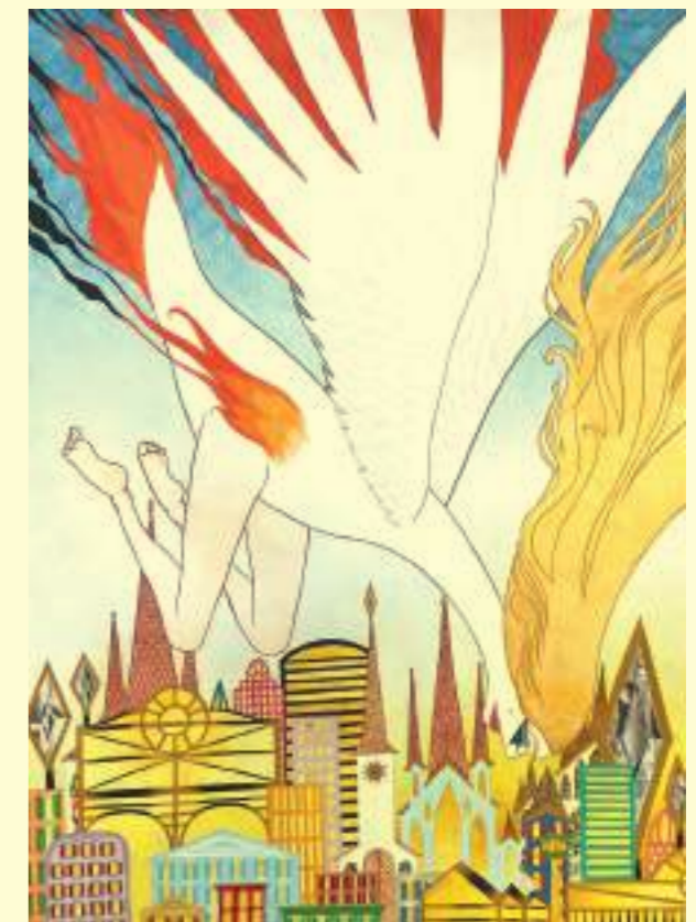
Caroline Tschumi: L'ange poulet, 2021.