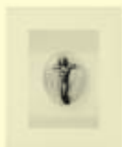
Salvador Dalí: Christ au Galet, 1959