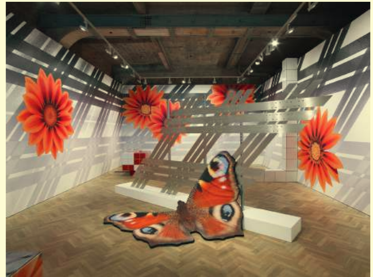
Anthea Hamilton: Prude Wallpaper, 2018. Peacock, 2018. Slanted Tartan Frame, 2018.