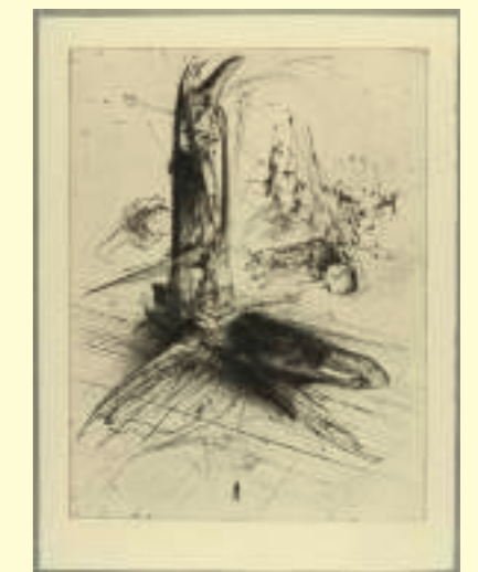
DADO: Sans titre, 1982.