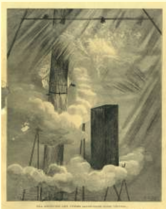
Abdelkader Benchamma: Sans titre - Rayon bleu (planches), 2015.