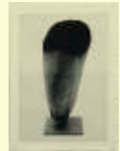
David Hammons: Rock Head, 2000