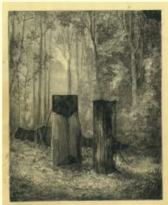
Abdelkader Benchamma: Sans titre - Rayon bleu (Monolyte), 2015.

Nathalie Du Pasquier résume ainsi son parcours «[...] J'ai commencé à travailler comme dessinatrice de tissus indépendante, ce qui est une bonne école. Lors de ma participation à l'expérience Memphis entre 1981 et 1987, j'ai aussi dessiné des meubles, des objets et beaucoup d'autres choses qui n'ont jamais été réalisées. Cela a été le moment où j'ai commencé à mettre en place une espèce d'alphabet de signes qui ont ré-émergé après plusieurs années dans mon travail. En 1987 j'ai peint mes premiers tableaux et ma vie a changé 1 . » La typologie des cabines apparaît dans son œuvre en 1999 et évolue en des formes de plus en plus sophistiquées. Ces espaces permettent de soutenir d'autres œuvres, à l'intérieur et à l'extérieur. L'artiste dit de la pièce donnée au Mrac qu'elle est comme « une petite maison sans fenêtre, c'est l'intérieur de ma tête dans laquelle sont installées des choses que j'aime ». Elle dit encore : « Plus on vieillit, plus cette installation peut devenir complexe. C'est une opération exempte de nostalgie car les nouveaux objets qui résultent de ces juxtapositions sont complètement nouveaux pour moi aussi. » Pour Le Retour, Cabina accueille et combine les dessins et les céramiques d'autres artistes.