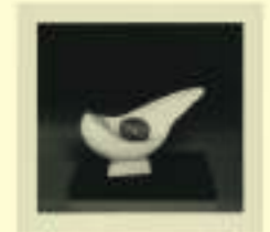
Kurt Schwitters: Mother and Egg, 1945-47