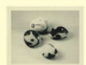
Max Ernst: Untitled (four painted stones), 1935