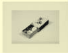
Sonja Sekula: Untitled (Matchbox), 1961