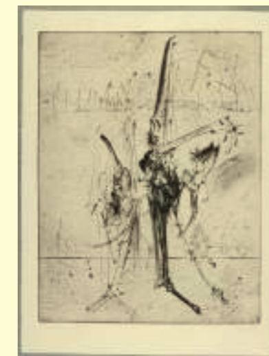
DADO: Sans titre, 1982.