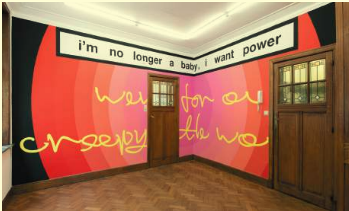
Nora Turato: i'm no longer a baby, i want power / went for a creepy little walk, 2020.