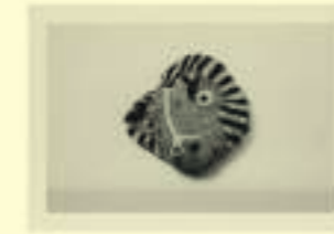
Georges Hugnet: Painted Stone in the Form of a Mask, 1955