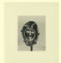
Pablo Picasso: Tête de Faune, n.d.