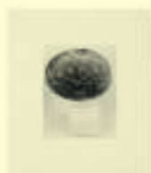
Pablo Picasso: Visage aimable, Plage de Golfe Juan Galet, n.d.