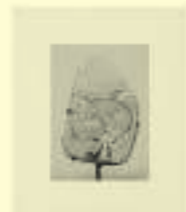
Pablo Picasso: Tête de Faune, n.d.