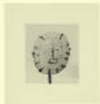
Pablo Picasso: Visage, n.d