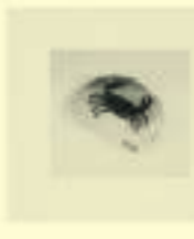
Georges Hugnet: Le Crabe, 1955