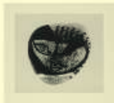
Le Corbusier: Galet, n.d.