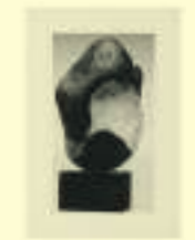
Georges Hugnet: Le fils d'Ubu, n.d.