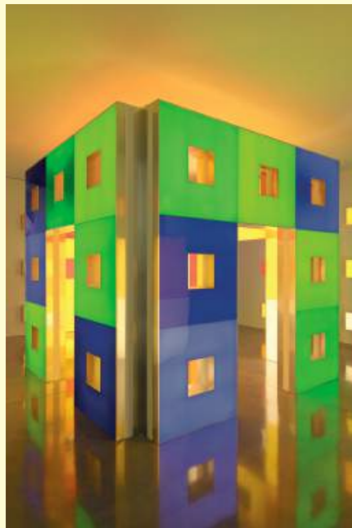
Daniel Buren: La Cabane éclatée aux caissons lumineux colorés, décembre 1999 - janvier 2000. © DB - Adagp, Paris. Photo: Aurélien Mole.