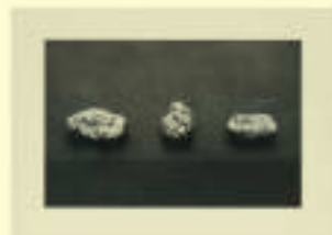
James Lee Byars: EINSTEIN, STEIN AND WITTEGENSTEIN, 1984/89