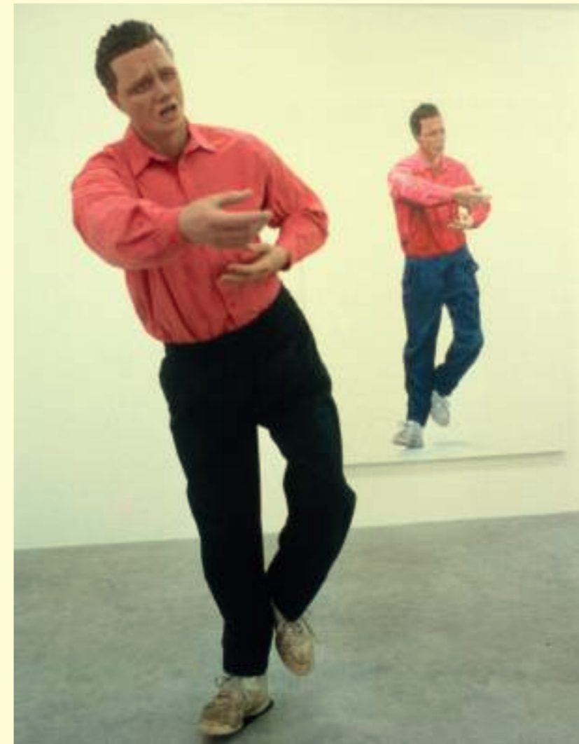
Jim Shaw: Dream Object (I was going through an art exhibition [...]), 1999.

Les œuvres montrées ici appartiennent à une vaste famille, celle des tirages réalisés entre l'été de 1981 et l'automne de 1982, à l'atelier Lacourière-Frélaut, à Paris, où l'artiste travaille treize cuivres, qui donnent naissance à une cen-