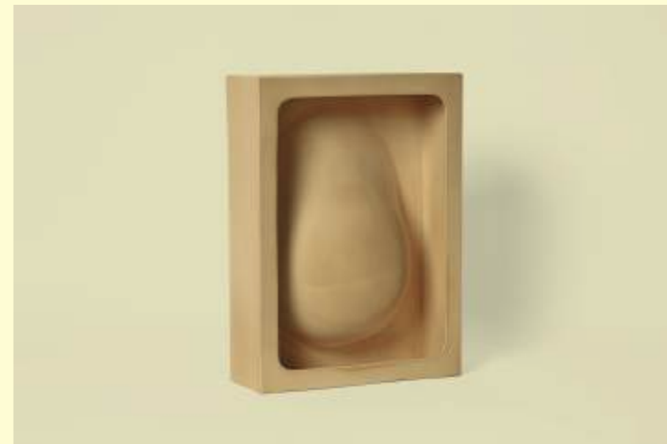
Nicolas Deshayes: Spud, 2018. © droits réservés / Cnap.

Depuis des années, elle poursuit la série des « Kangas », s'inspirant d'un habit usuel en Afrique orientale. Le kanga est une pièce de coton rectangulaire orné de motifs de couleurs vives, avec une image centrale et une bordure. Une phrase, le plus souvent un proverbe, une prière ou une devise, est parfois inscrite sur l'un des bords. Dans cette production populaire, l'étincelle sémantique entre texte et image peut être aussi puissante que dans un tableau surréaliste ou dans le souvenir d'un rêve. Lubaina Himid reprend cette structure pour mieux faire circuler des citations de poète et poétesse, de militant-e et ses propres aphorismes.