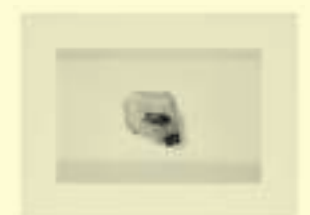
Calcaires peints du Paléolithique tardif, vers. 15 000 ans, trouvés dans la grotte de Fels, Allemagne.