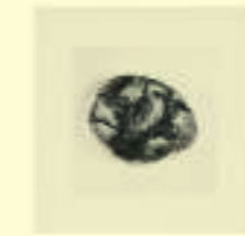
Georges Hugnet: La Chouette, 1955