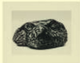
Fahrelnissa Zeid: Sea Rock, n.d.