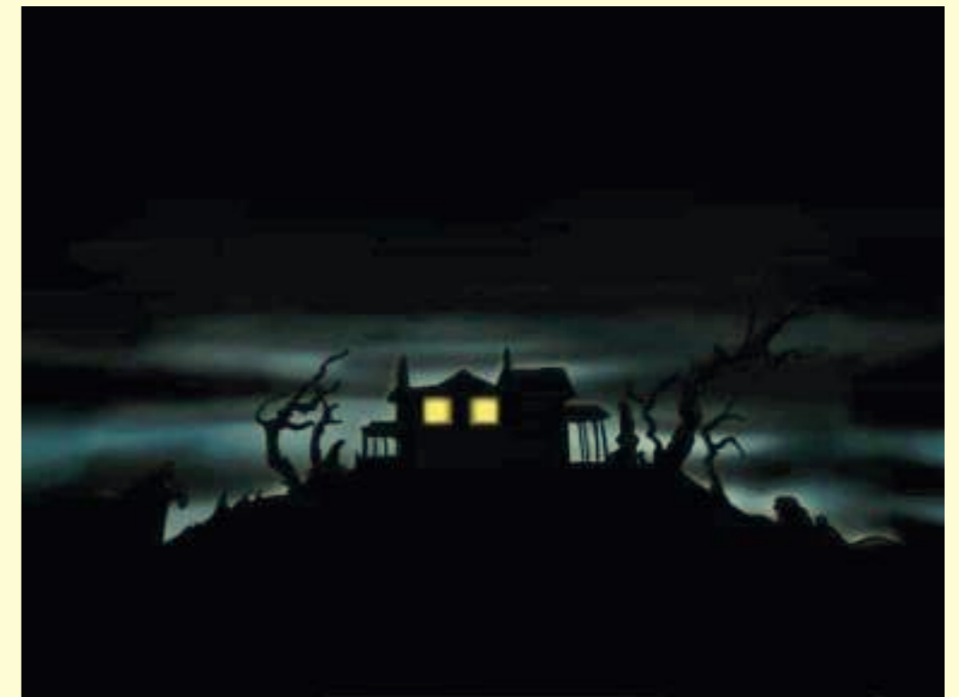
Bruno Botella: L'Invention du rire, 2000. © Bruno Botella / Cnap.