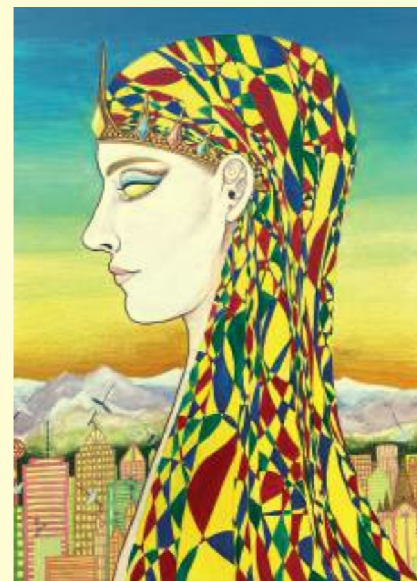
Caroline Tschumi: Reine, 2021.