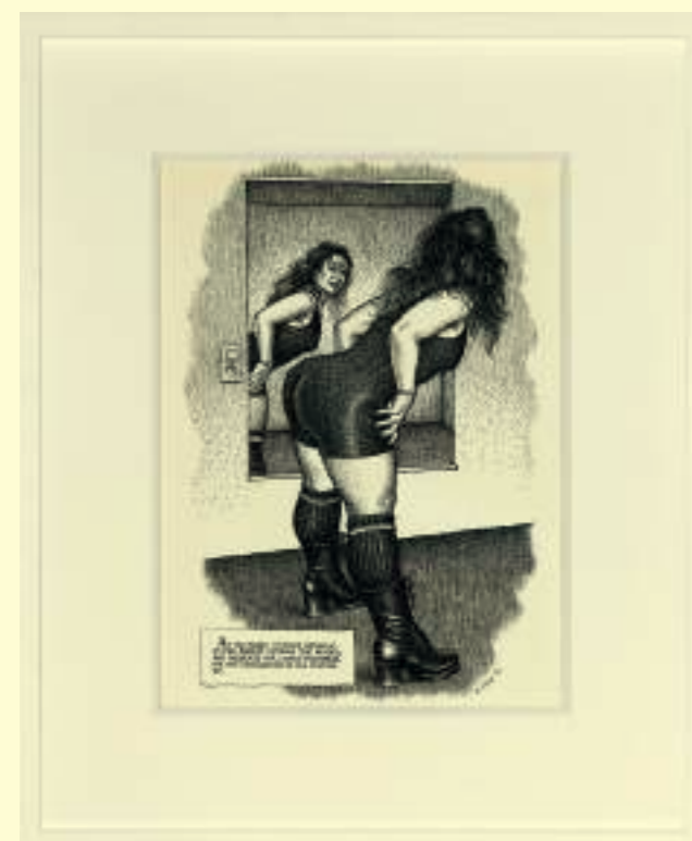
Robert Crumb: As the Model Studies Herself, 2002.