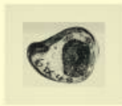
Annemarie von Matt: Herzform-Stein, n.d.