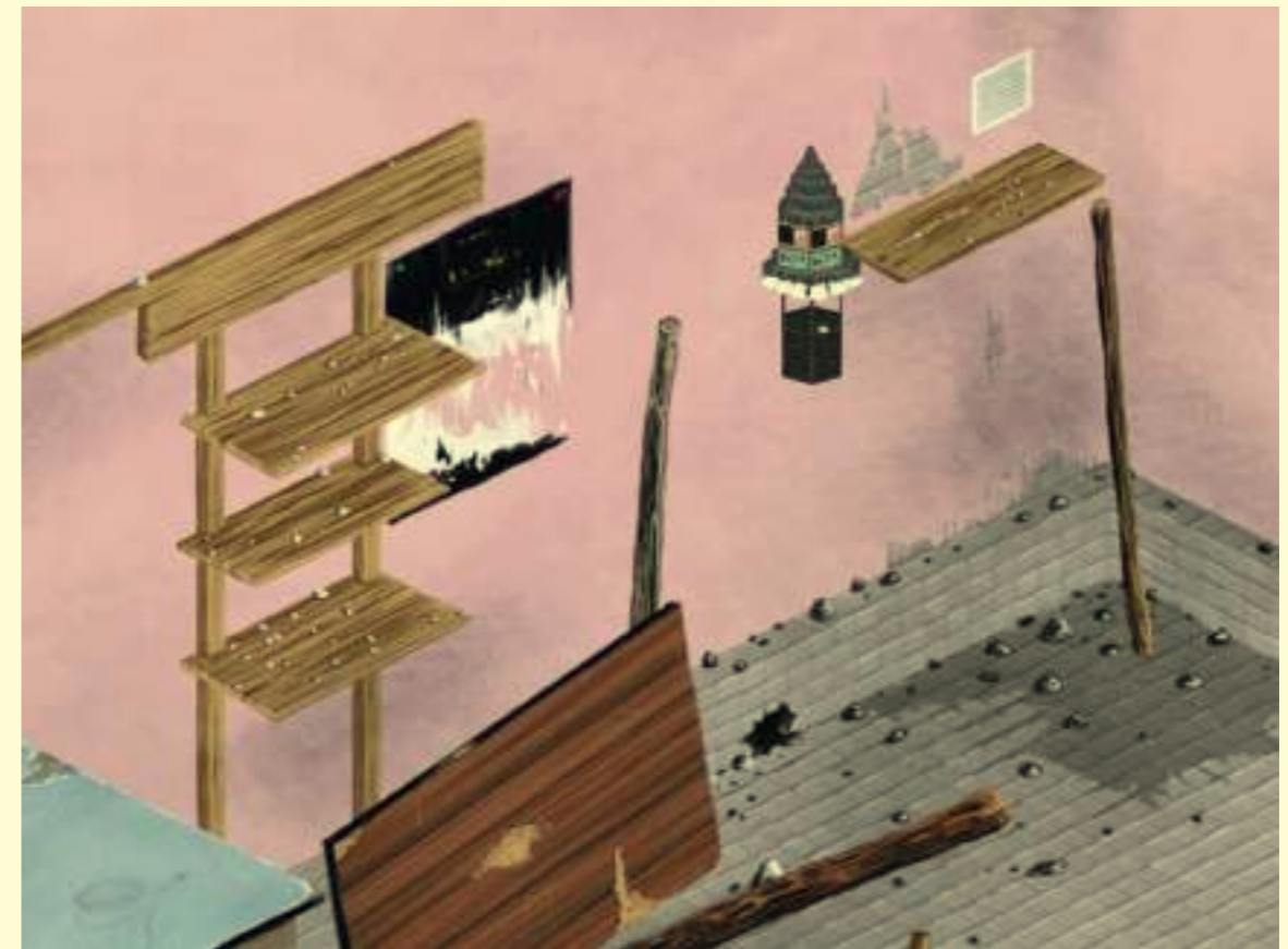
Bruno Botella: Les Queues hantées, 2008.