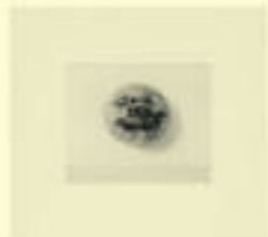
Annemarie von Matt: Stein der Dummen, n.d.