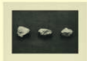
James Lee Byars: THE THREE B'S: BEUYS, BROODTHAERS, BYARS, 1984/89