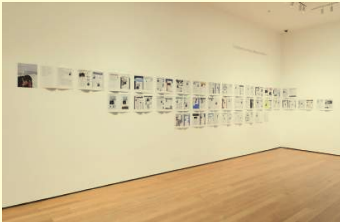
David Horvitz: Mood Disorder, 2012. © David Horvitz / Cnap. Vue de l'exposition «Ocean of Images: New Photography 2015», MoMA, New-York, 2015. Photo: Thomas Griesel