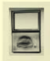
Georges Hugnet: Baiser, 1955