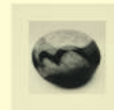
Max Ernst: Untitled, 1934