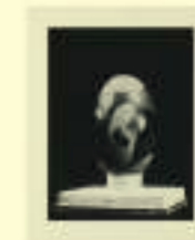
Max Ernst, Untitled (painted granite pebble from Maloja), 1939