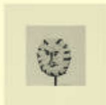
Pablo Picasso: Visage, n.d