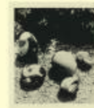
Max Ernst: Untitled, 1935