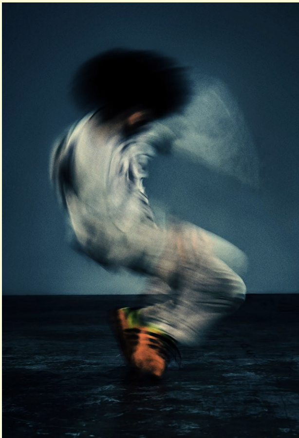
Nestor Benedini: B-Boy Feeds/Motion, 2024. De la série Breakin'Codes, 2024. Collection du Cnap