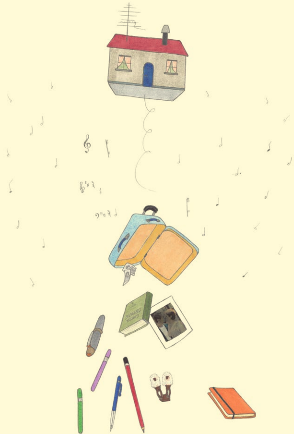
Jeanne Susplugas: Flying House (A.P.), 2020. © Jeanne Susplugas.

C'est dans une sorte d'interstice, de fissure originelle que réside et croît l'œuvre de Jeanne Susplugas (née en 1974 à Montpellier, France) ; une exploration sensible du corps, entre ingénuité enfantine et violence. Qu'il soit métaphorique, absent, morcelé, érotique ou malade, le corps comme entité suggestive devient prétexte à sonder des questions universelles comme la solitude, le désordre psychologique, la faiblesse, l'addiction, la folie ou encore l'obsession.