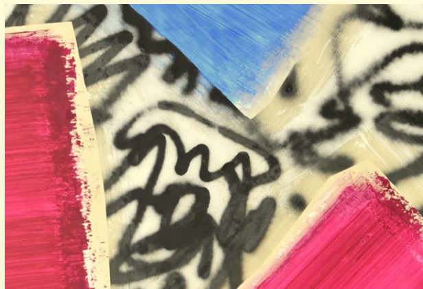
Renée Levi : Morena (6), 2019 (détail).

22h. Le Mrac, un musée sous les étoiles : Découverte nocturne des œuvres extérieures.