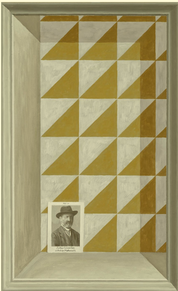
Christian Hidaka: Niche III (Geometrical models), 2016. Collection Départementale d'art contemporain de la Seine-Saint-Denis.