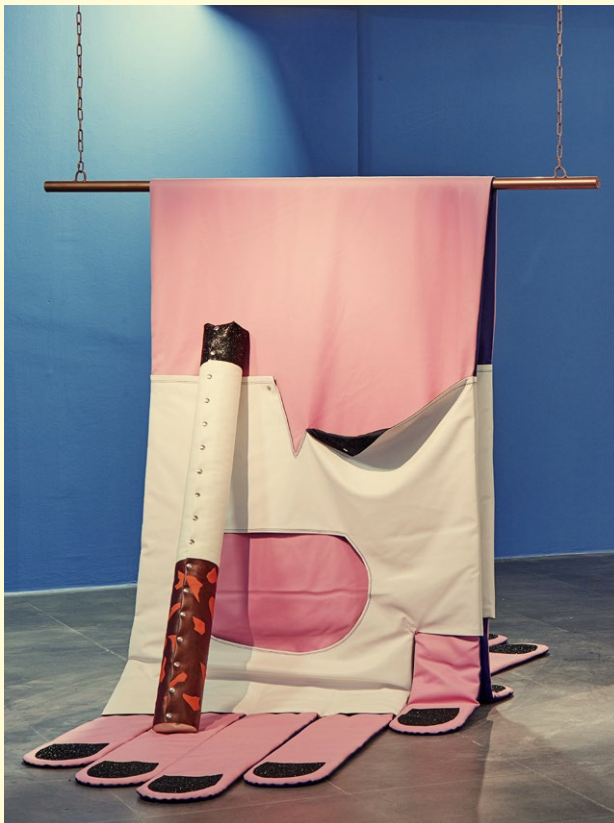
Hippolyte Hentgen: Le Bikini invisible, 2019. Centre national des arts plastiques, © Adagp, Paris/Cnap.